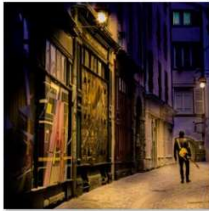
NB1 Avant .jpg