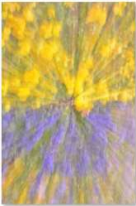
MG Flou séance 2.JPG