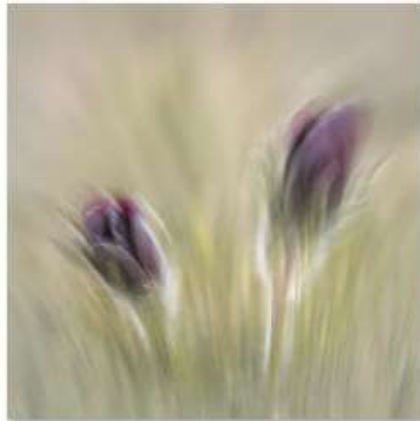
NB2 Flou assumé.jpg