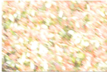
TPD3_Flou assumé manuel et violent.jpg