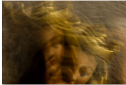
SMA flou assumé.jpg