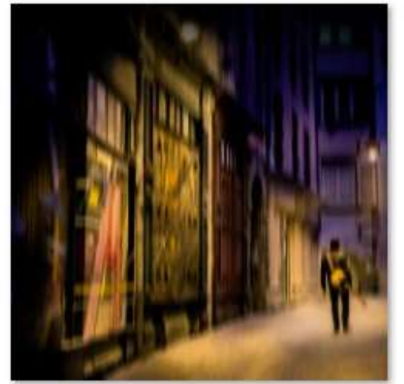
NB1 FLOU presque assumé copie.jpg