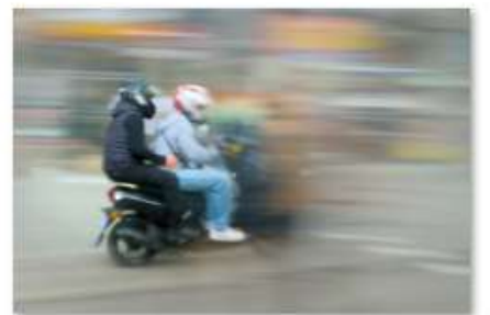
PK_2024-03b_flou et assumé.jpg