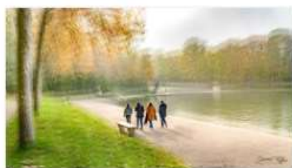
DK_Flou assumé -01.jpg