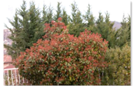
TPD1_Photo avant flou assumé.jpg