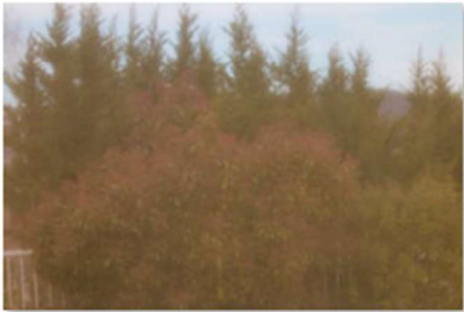
TPD2_Flou assumé avec écran.jpg