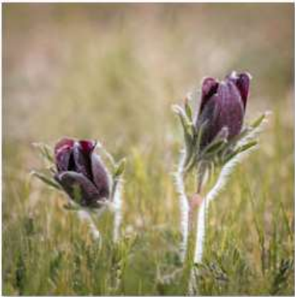
NB2 avant flou.jpg