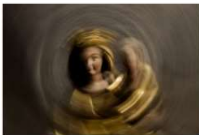
SMAsortie2 et flou assumé.jpg